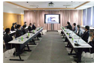
分科会B 大学運営・研究・社会貢献等