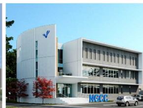
ニューロン-グリアクロストークセンター山梨 (医学部キャンパス)