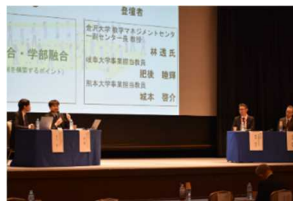
2日目 テーマ別セッション

開催1日目は基調講演及び6大学による採択地域事業説明、2日目はテーマ別セッションが行われ、活発な情報交換や意見交換が行われた。