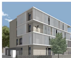
ゼロエミッション みらいラボ (甲府東キャンパス)

本学では、文部科学省が公募した「地域中核・特色ある研究大学の連携による産学官連携・共同研究の施設整備事業」に申請し、採択された。 本事業は、地域中核・特色ある研究大学として機能強化を図る大学に対し、共同研究拠点施設やオープンイノベーション創出等に必要な施設整備を支援するものであり、本学は提案大学として「クリーンエネルギー研究拠点施設整備」、連携大学として「先端脳科学研究拠点」を申請した結果、2件とも採択された。 今回の採択を受け、本学では甲府東キャンパスに「ゼロエミッションみらいラボ(クリーンエネルギー研究)」、医学部キャンパスに「ニューロン-グリアクロストークセンター山梨(先端脳科学研究)」の整備を進めている。