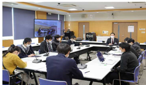
業務改善プロジェクトチーム ミーティング

本チームは、各部署から選出された若手職員メンバー14名によって構成されており、業務効率化に向けた検討が進められている。